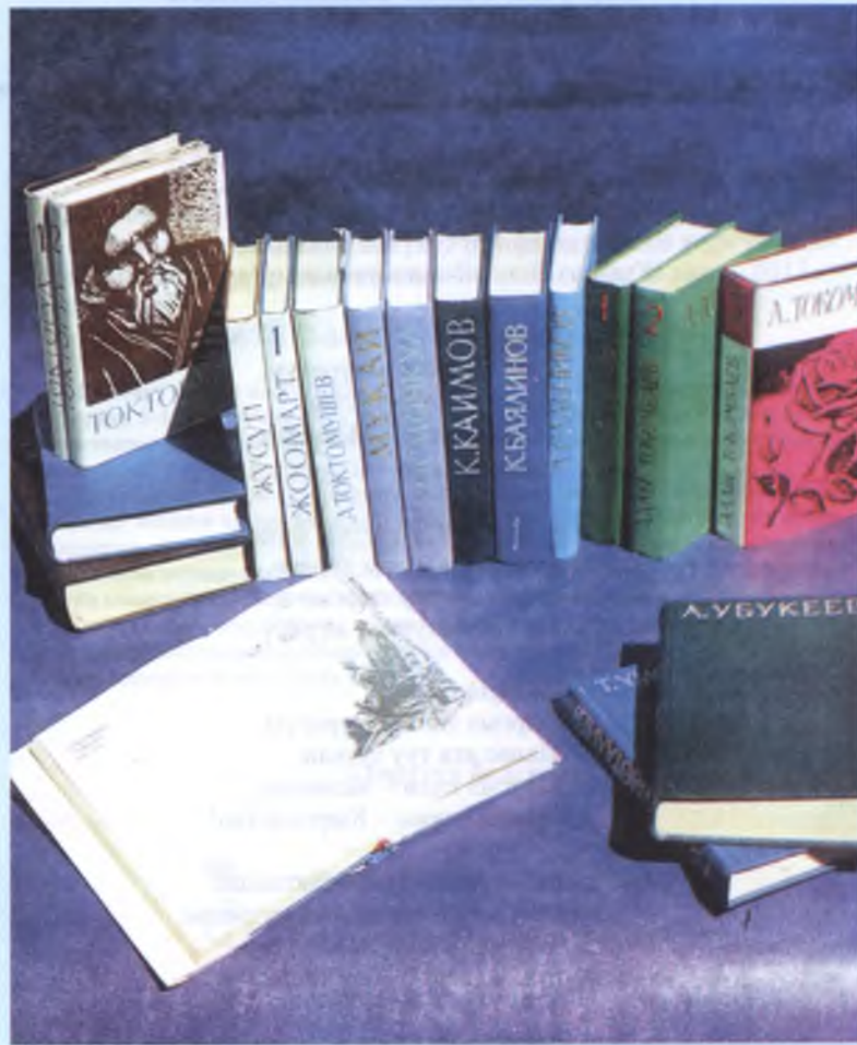
Адабий чыгармалардын жыйнактары

Адам жаралып, сүйлөп, ойлоно баштагандан кийин анын дүйнөсүн сөз өнөрү – адабият аралай баштайт. Наристе ( младенец ) кезибизден баштап эле бешик ырларын угабыз. Тилибиз чыгып, сүйлөй баштагандан кийин өзүбүздүн оюбузду сөз аркылуу түшүндүрө баштайбыз. Чоң апалардын, чоң аталардын жомокторун, акыл сөздөрүн угуп, көркөм, образдуу сүйлөөгө аракет кылабыз ( стараямся ).